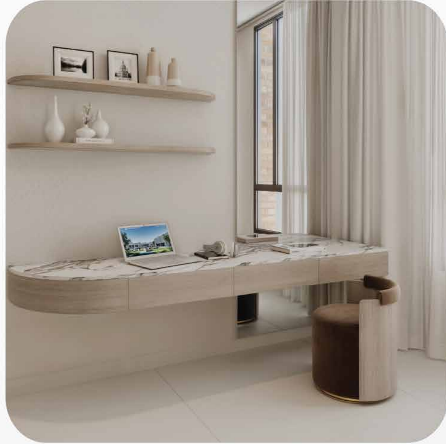
المصممون في دبي هم أول من حققوا أعلى جودة The masterplans are designed to be adaptable, ensuring expectations are met and the highest quality is achieved.