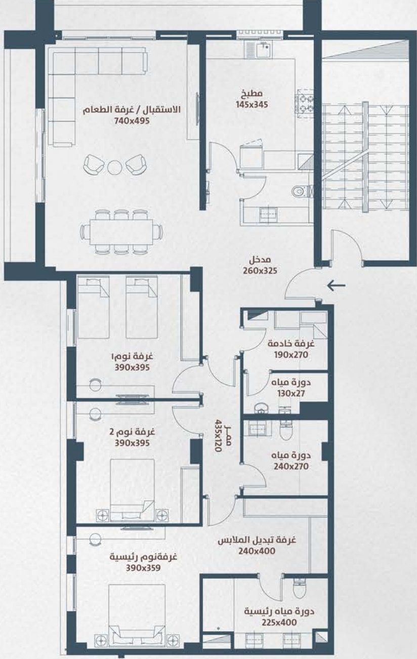
مخطط الدور الأول (عرض مُقَرَّب) First Floor Plan (Zoomed View)